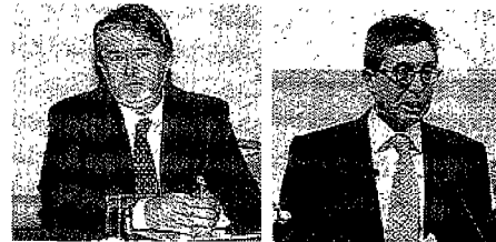
Giuliano Poletti, presidente di Legacoop

miliardi , il fatturato delle 42 mila cooperative coinvolte nell'alleanza e che danno lavoro a 1,1 milioni di occupati